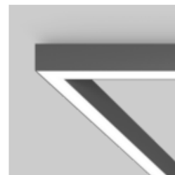
BASO 60 IP54 surface system