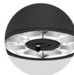
sensor version available