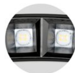
dark chrome reflector option