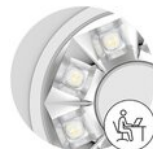
DIN EN 12464-1 UGR \leq 19