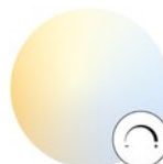
tunable white 2700 - 6500 K