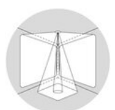
one luminaire multiple scenes