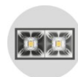
black & chrome reflector