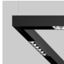
MOVE IT 45 surface / suspended system