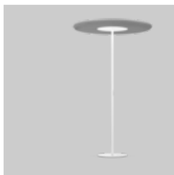
SONIC free standing