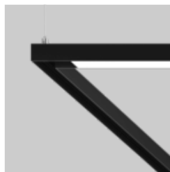
MOVE IT 25 S surface / suspended system