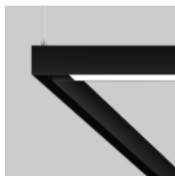
MOVE IT 25 surface / suspended system