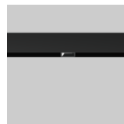
L1 MOVE IT 45