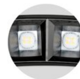
dark chrome reflector option