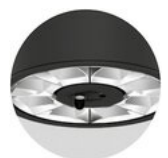
sensor version available