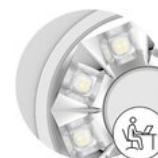
DIN EN 12464-1 UGR ≤ 19